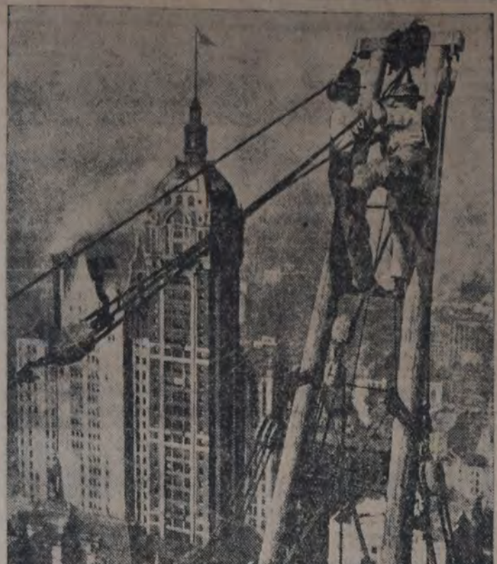
LA CRONICA DIARIA REGISTRA CON ALARMANTE FRECUENCIA SU- cesos trágicos que se desarrollan durante las múltiples y peligrosas tareas que demanda la edificación en las grandes ciudades. En esta magnífica fotografía vemos a dos obreros de la construcción en una peligrosa situación que exige valor y buen temple de los nervios