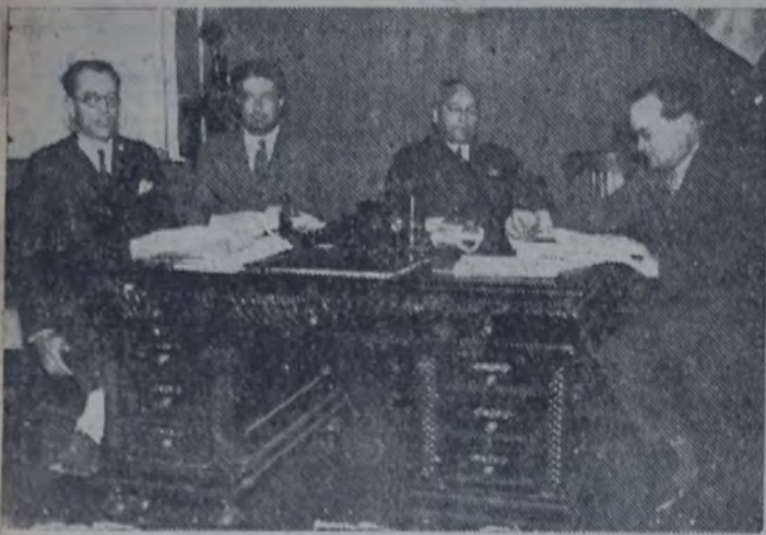
EL GRUPO LEGISLATIVO SOCIALISTA

Conforme a las prescripciones de sus estatutos y a las prácticas de nuestro partido, la Federación Socialista Bonaerense ha convocado a los centros de la provincia para celebrar el IX congreso ordinario, que, en nuestra Casa del Pueblo, iniciará sus tareas el próximo 12 y las proseguirá el 13 y 14.