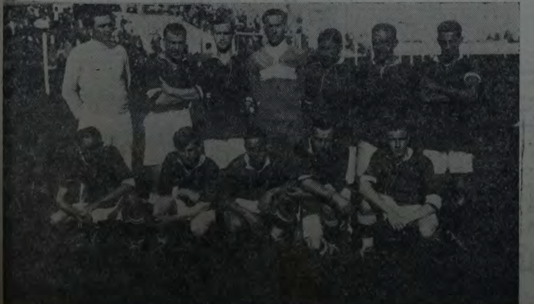
EQUIPO DE LA FEDERACION PARANAENSE, QUE AL VENCER AL TUCUMANO, POR 1 A 0, SE CLASIFICÓ PARA LAS SEMIFINALES DEL CERTAMEN NACIONAL.