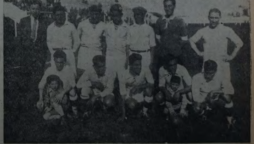
EQUIPO DE LA FEDERACION TUCUMANA, QUE FUE ELIMINADO DEL CAMPEONATO ARGENTINO POR EL CUADRO PARANAENSE.