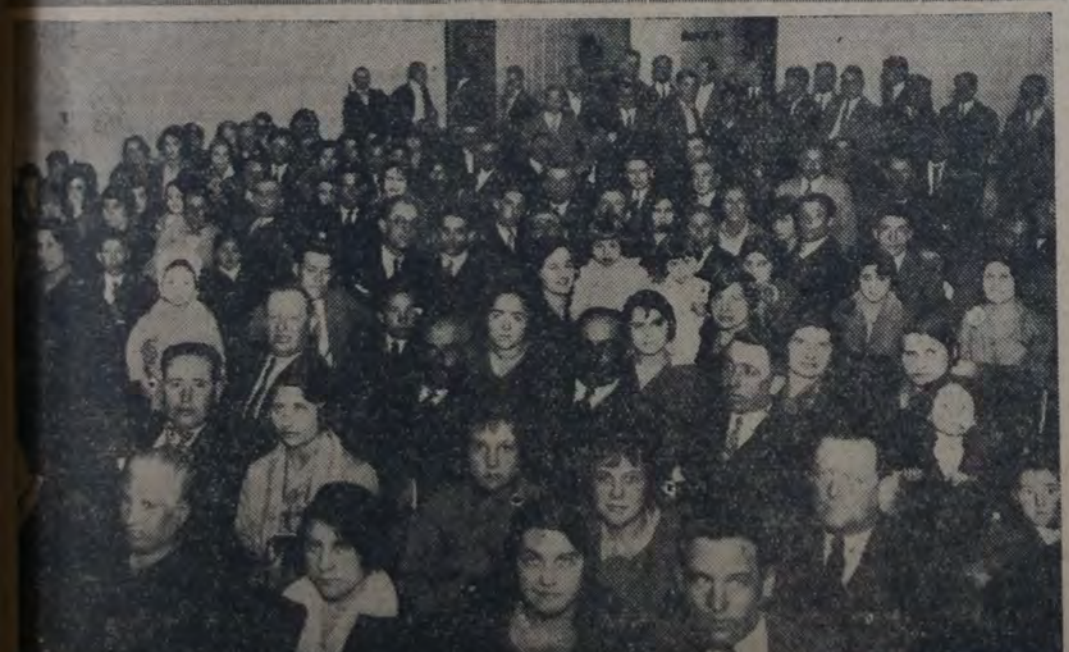
PARTE DE LA CONCURRENCIA QUE ASISTIO A LA VELADA QUE SE REALIZO ANTEAÑO EN CONMEMORACION DEL 60. ANIVERSARIO DE LA FUNDACION DE LA UNION FERROVIARIA