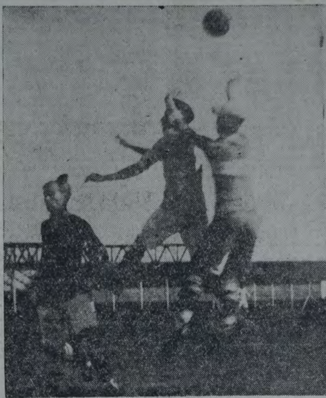
SOBRE EL ARCO DE PARANÁ, SU GUARDIAN EFECTUÓ UN OPORTUNO RECHAZO.

Instantes después, el juez dió por terminada la lucha. Por consiguiente, Liberal Argentino, se adjudicó la copa, con dos victorias.