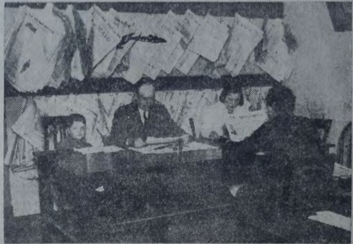
MESA DE LECTURA DE LA FEDERACION

tido en la provincia, estableciendo la comparación con la similar anterior.