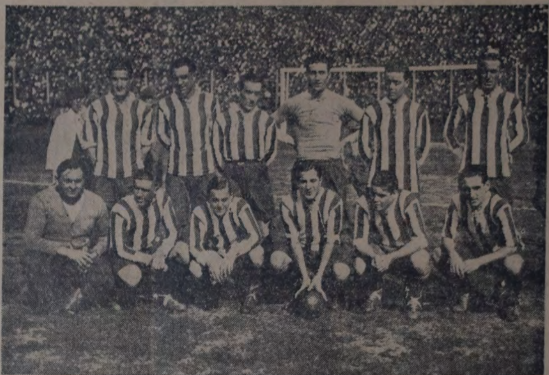
EQUIPO "CAPITAL", DE LA ASOCIACIÓN AMATEURS ARGENTINA, QUE DESPUES DE HABER GANADO POR 2 tantos contra 1 frente a "Provincia", perdió ayer, por la segunda runda del Campeonato Argentino, frente al entusiasta cuadro de la Liga Cultural, de Santiago del Estero, por 3 tantos contra 2.

Con este resultado, la Federación Paranaense quedó clasificada para disputar la semifinal con los Rosarinos, partido que se realizará mañana.