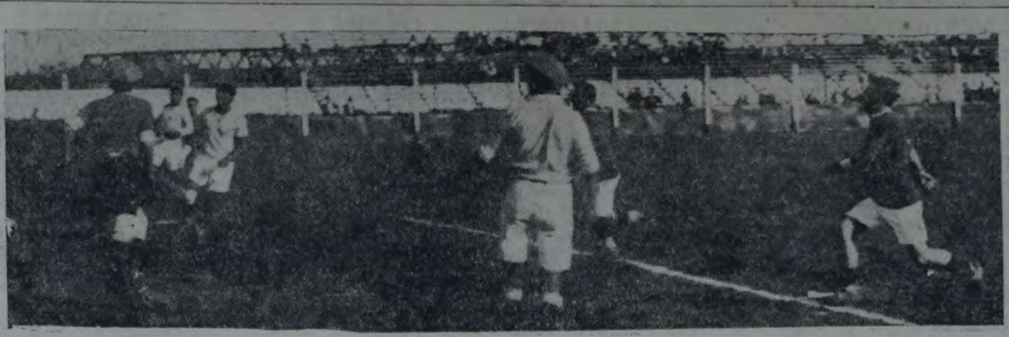
EL ARQUERO TUCUMANO SE PREPARA PARA INTERCEPTAR UN TIRO DE UN AGIL PARANAENSE