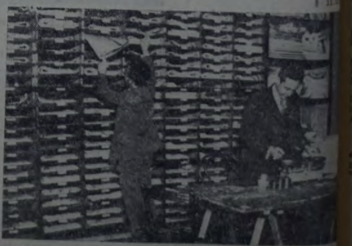
ARCHIVO DE PADRONES Y EXPEDICION DE CORRESPONDENCIA

Señala, finalmente, el informe los dos factores que a juicio de la Junta de la Federación dificultan y hasta detienen la acción socialista en la provincia: la extensión y el arraigo de fuertes grupos tradicionales de la oligarquía criolla, que encuentra en el latifundio y en sus estancias el seguro instrumento de predominio electoral y de opresión política.