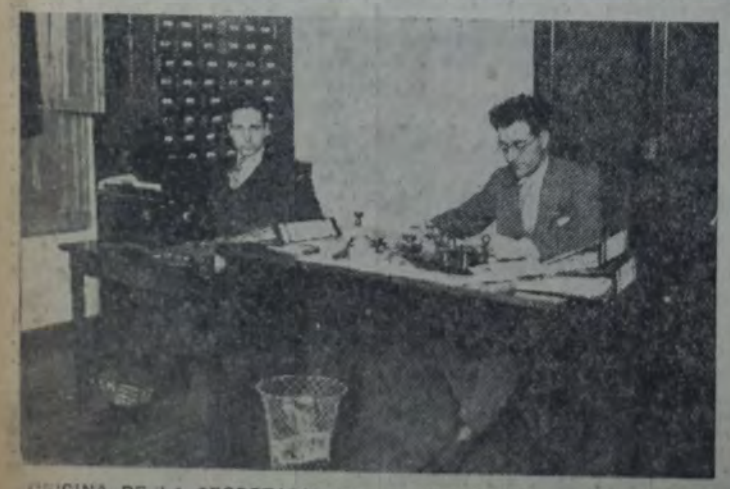
OFICINA DE LA SECRETARIA DE LA FEDERACION Y EMPLEADOS de la misma

Dos cuestiones de orden interno difíciles se presentaron a la Junta en el período que nos ocupa: primeramente, la proyectada intervención federal a la provincia, que provocó una incidencia interna de proporciones, y, seguidamente, la división planteada al Partido