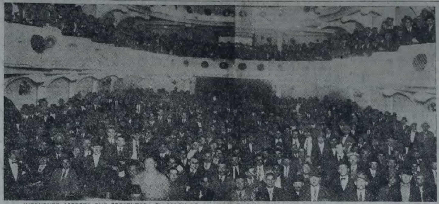
IMPONENTE ASPECTO QUE PRESENTABA EL SALÓN DE LA VERDI DURANTE LA ASAMBLEA DE MARITIMOS REALIZADA AYER